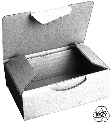
CONDITIONNEMENT PAR 50

Prix susceptibles d'être modifiés en cas de variation importante du coût des matières premières.