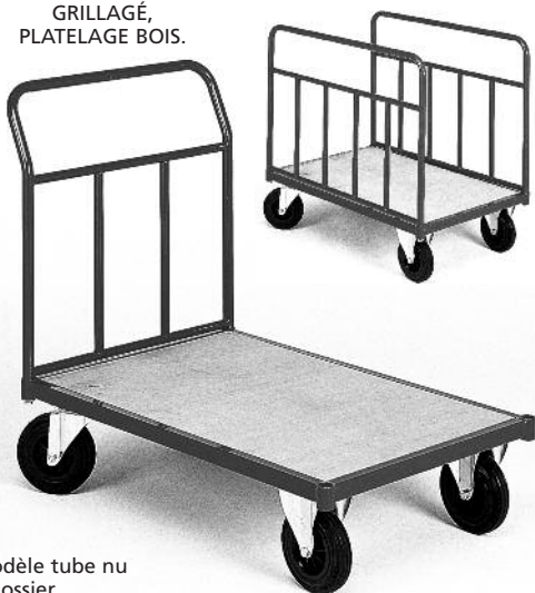
Modèle tube nu 1 dossier

3 OPTIONS : TUBE, GRILLAGÉ, PLATELAGE BOIS.