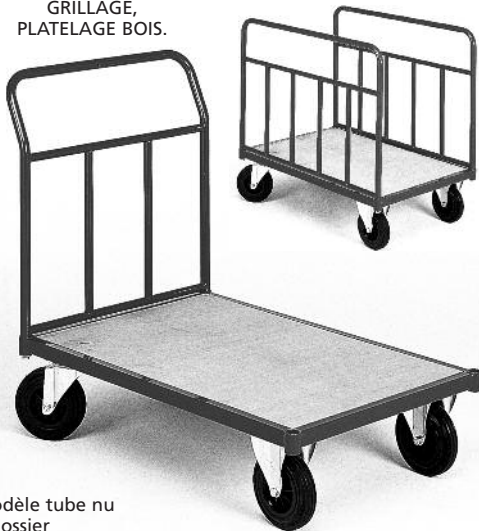
Modèle tube nu 1 dossier

Chassis tube 30 x 15 et 20 x 20 avec plateau encastré en contreplaqué ép. 10 mm. Dossier et ridelles amovibles tube Ø 30, Haut. 720. Roulements : 2 roues fixes, 2 roues pivotantes à bandages caoutchouc semi élastique Ø 160. Hauteur totale des chariots = 960 mm. Hauteur sol/plateau : 235 mm. Coloris : bleu